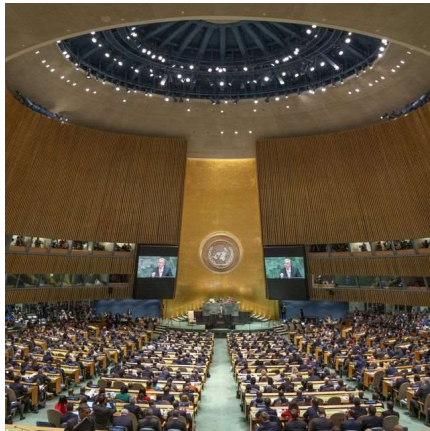
78. Generalversammlung der UNO 2023

Frage 1: Wie funktioniert die Generalversammlung der UNO? Studieren Sie dazu das Kapitel IV der Charta.