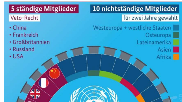
Zusammensetzung des Sicherheitsrates der UNO